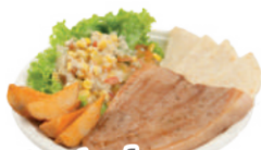
Punta de anca a la plancha