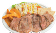
Cabeza de lomo a la plancha