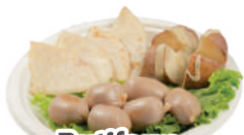
Butifarra a la plancha