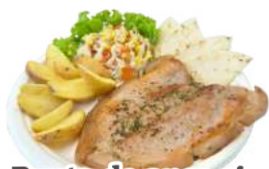
Punta de anca sin piel a la plancha