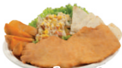
Carne de cerdo apanada