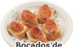
Bocados de chorizo español