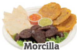
Morcilla a la plancha